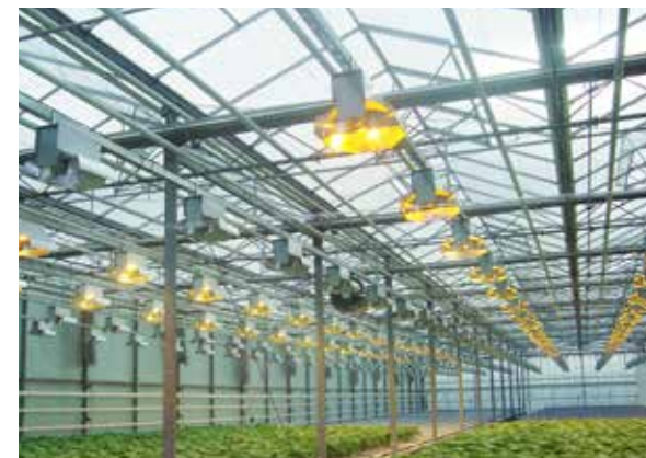
Строительство 1-й очереди тепличного комплекса ООО «Гринхаус» на территории Старооскольского городского округа