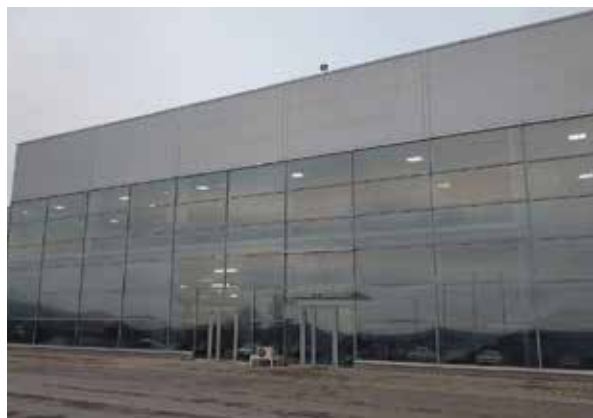
Увеличения производственных мощностей ООО «Биосфера Полимер»