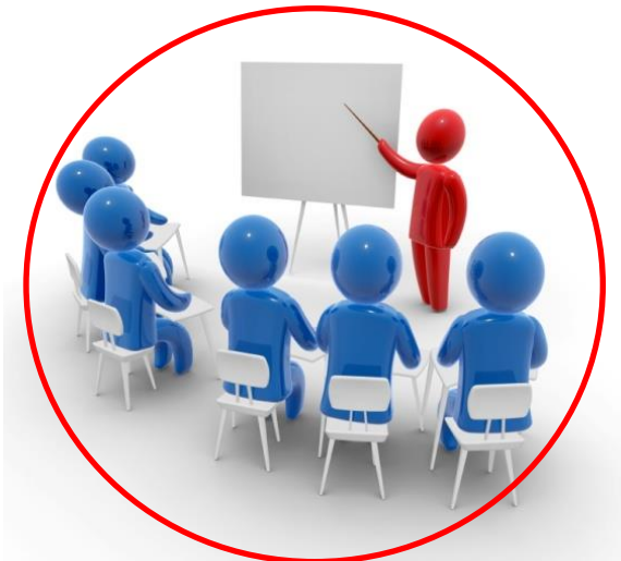
Рассмотрение на ЭК